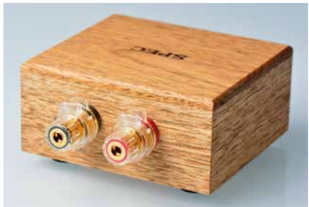
SPEC REAL SOUND PROCESSOR AZ9EX

At seventeen is een remaster van Janis Ian, ik prefereer het zachtere origineel, de bewerking laat wel horen waartoe de speaker in staat is. Ian blijft op afstand staan net voor de speakers in een stereobeeld met diepte, muziek komt opnieuw helemaal los, hangt wel in de breedte tussen de speakers en gaat niet verder naar links of rechts. Heel af en toe komt toch het specifieke karakter van een hoorn tevoorschijn, dat in het niet valt bij de voordelen van een grote dynamiek, het gemak