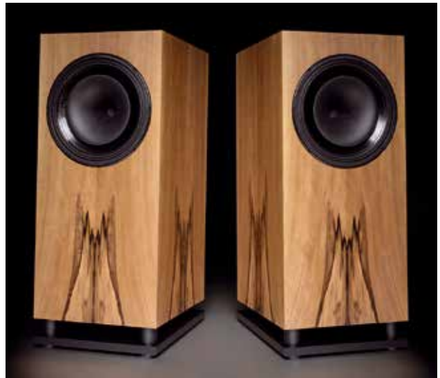
TOBIAN MONITOR 15HC

en de losheid. In hoeverre de ruimte daarbij een rol speelt is mij uiteraard onbekend. Martha Argerich speelt live in Lugano een pianoconcert van Mozart. Dat laat horen wat een groot orkest kan doen op een groot systeem. Hier komen alle voordelen bij elkaar: de transparantie, de dynamiek, de afbeelding, het gemak en de rust in de weergave. Gaaf om te horen hoe de vleugel integreert met het orkest, pas als het orkest vol inzet verdwijnt de vleugel even uit beeld. Het is een mooie opname met een heel realistische afbeelding. Als Martha kracht gaat zetten komt de vleugel los met een klankkast die vol in beeld is. Een 15 inch conus en circa 250 liter kast, zij zijn noodzakelijk om een instrument van die afmeting terug te laten komen in een huiskamer of luisterruimte. Rachel Podger speelt in een veel kleinere bezetting "Bach Double & Triple concertos", in een heel levendig spel, met prachtige aftekening van de instrumenten en op de achtergrond het tingelende klavecimbel.