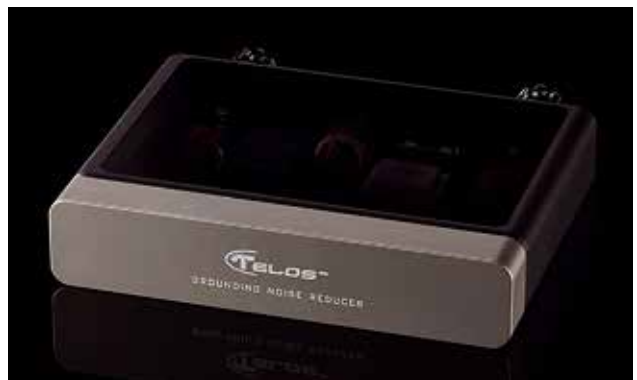
TELOS GROUNDING NOISE REDUCER MINI

Voor het streamen van muziek vanaf Tidal met Roon software en het omzetten van de digitale stroom naar analoog maken we gebruik van een Sforzato DSP-050 muziekspeler. De DSP-050 maakt intern gebruik van twee paar ESS Sabre Dac's, de ES9038Pro, waarbij de interne chipklok wordt uitgezet en vervangen door een hoogwaardige klok in de speler. Daarmee is het jitterlevel niet langer afhankelijk van de digitale bron. De TCXO met zijn daaraan gekoppelde IC haalt een jitterwaarde lager dan 100 femto seconden. Gaples afspelen is mogelijk